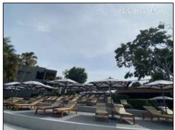
ภาพที่ 1.2-2 – สภาพโครงการปัจจุบัน